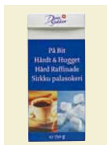
På Bit, 750 g Art nr: 42035

Antal/bricka: 16 × 500 g Mockabitsocker är små snabblösliga sockerbitar.