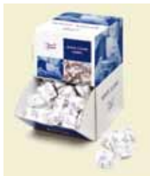
Snabbit, 2 stk, 7 g, 1, 05 kg, Display Art nr: 42227 Antal/låda: 300 st