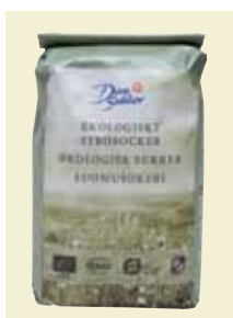
Strösocker Ekologiskt, 1 kg Art nr: 41210 Antal/bunt: 10 x 1 kg