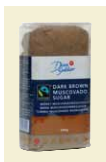
Mörkt Muscovado-råsocker, 500 g Art nr: 41642

Antal/bricka: 6 x 500 g Ljust Muscovadoråsocker användes med fördel som krydda i matlagning. Passar mycket bra till fisk och rotfrukter. Förhöjer smaken på bröd, mjuka kakor, småkakor, desserter, marinader, såser och inläggningar.