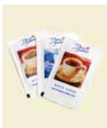
Strösocker Påse, 6 g, 5 kg, Wellåda Art nr: 41401 Antal/låda: 845 st