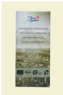
Florsocker Ekologiskt, 500 g Art nr: 43202 Antal/bricka: 6 × 500 g

Det som skiljer de ekologiska sockerprodukterna från våra ordinarie produkter är odlingen. Ekologiska sockerprodukter odlas helt utan kemiska bekämpningsmedel och handelsgödsel. Växtnäringen kommer från stallgödsel och andra gödselmedel som är tillåtna i ekologisk odling.