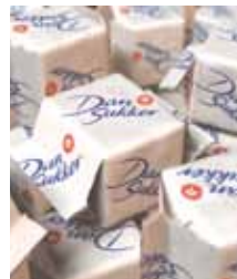
Snabbit, 2 stk, 7 g, 7,5 kg, Wellåda Art nr: 42226 Antal/låda: 1070 st