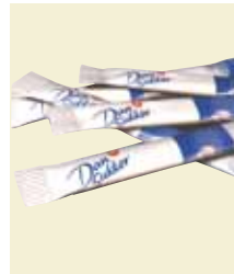
Strösocker Sticks, 5 g, 5 kg, Wellåda Art nr: 41402 Antal/låda: 1000 st