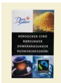
Rörsocker Strö, Fairtrade, 500 g Art nr: 41655 Antal/bricka: 2 x 7 x 500 g