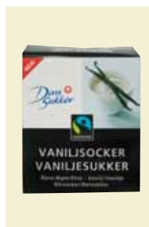
Vaniljsocker Fairtrade, 170 g Art nr: 47007

Antal/bricka: 16 x 500 g Minibitsocker Ekologiskt Rörsocker är små snabbblösliga sockerbitar. Sockret är Fairtrade-certifierat och kommer från ekologiskt odlade sockerrör.