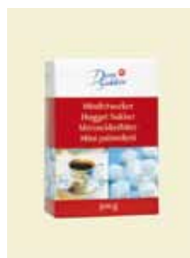
Minibitsocker, 500 g Art nr: 42212

Antal/bricka: 10 × 1 kg Bitsocker innehåller hårda sockerbitar med lång smälttid.