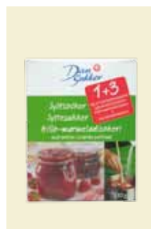
Syltsocker I+3, 330 g Art nr: 47110

Syltsocker är en produkt för dig som inte syltar så mycket idag. Med hjälp av Syltsocker gör du din egen sylt eller marmelad på några minuter. I paketet som innehåller 1 kg finns allt du behöver för ett lyckat syltkok; Socker, äppelpektin, citronsyra och natriumbensoat. Det enda du tillsätter är bären och ev lite vatten. Du kan använda både färska och frysta bär.