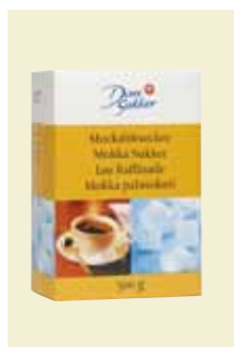
Mockabitsocker, 500 g Art nr: 42205

Antal/bricka: 12 × 500 g Snabbitsocker innehåller sockerbitar med kort smälttid, här i praktisk bordsförpackning.