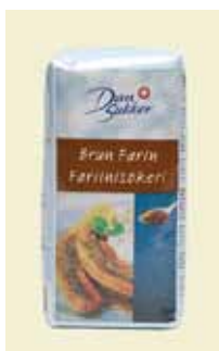
Farinsocker, 500 g Art nr: 45206 Antal/bricka: 12 x 500 g

Farinsocker finns i två varianter, en torr lättrinnande (Brun Farin Strö) samt en fuktig (Brun Farin). Brun Farin Strö består av sockerkristaller och mörkbrun rörsockersirap. Brun Farin Strö är något av en okänd krydda som ger en ny pikant smakupplevelse. Farinsocker är socker som blandats med rörsockersirap. Ett gyllenbrunt fuktigt socker med aromatisk smak. Farinsocker ger en kryddig arom åt mat och dryck.