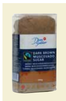
Mörkt Muscovado- råsocker, 500 g Art nr: 41642 Antal/bricka: 6 x 500 g Mörkt Muscovadoråsocker passar utmärkt i såser, marinader, chutney, chokladkakor, chokladdrycker och glass.