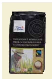
Ekologiskt Rörsocker Fairtrade, 1 kg Art nr: 41245

Antal/bricka: 8 x 400 g Cane Syrup har en rundare och fylligare smak och passar perfekt till all typ av bakning, i grytor, sallader, marinader – eller varför inte som topping? Sirapen är gjord på rörsocker och är dessutom rättvisemärkt.