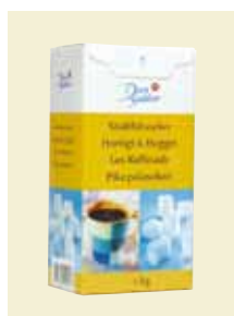
Snabbitsocker, 1 kg Art nr: 42020

Antal/bricka: 16 × 500 g Minibitsocker är små hårda sockerbitar med lång smälttid.