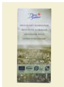
Florsocker Ekologiskt, 500 g Art nr: 43202