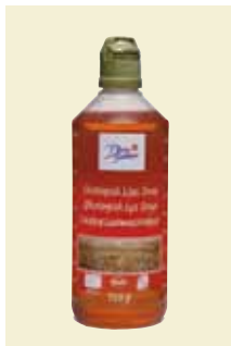
Ljus Sirap Ekologisk, 750 g Art nr: 46439 Antal/bricka: 8 × 750 g