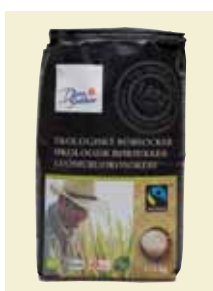
Ekologiskt Rörsocker Fairtrade, 1 kg Art nr: 41245 Antal/bunt: 10 x 1 kg Ekologiskt Rörsocker Fairtrade från Paraguay används som vanligt vitt strösocker och passar i många olika sammanhang.