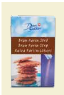
Brun Farin Strö, 500 g Art nr: 45202 Antal/bricka: 14 x 500 g