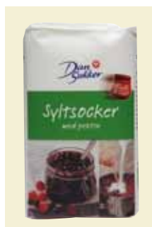
Syltsocker, 1 kg Art nr: 11247