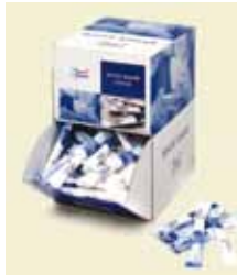
Strösocker Sticks, 5 g, 1,0 kg, Display Art nr: 41404 Antal/låda: 200 st