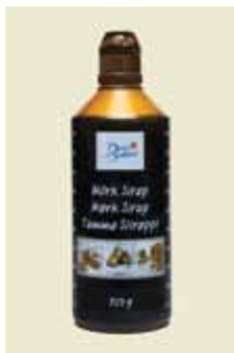
Mörk Sirap, 750 g Art nr: 46442

Antal/bricka: 4 × 2,8 kg Ljus Sirap finns också som Foodservice förpackning i en praktisk 2 liters dunk med handtag och målenheter.