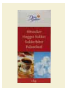
Bitsocker, 1 kg Art nr: 42209

Bitsocker finns i olika varianter där hårdheten och storleken på sockerbiten skiljer.