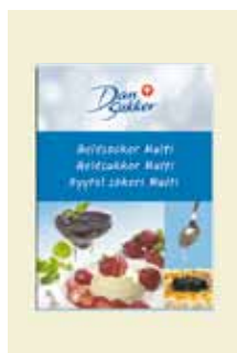
Gelésocker, 370 g Art nr: 47105

Nu finns ett alternativ för dig som vill ha en sylt eller marmelad med mindre socker. Syltsocker I+3 fungerar som vanligt syltsocker med bra konsistens och hållbarhet på sylten.