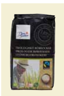
Ekologiskt Rörsocker Fairtrade, 1 kg Art nr: 41245 Antal/bunt: 10 × 1 kg Ekologiskt Rörsocker Fairtrade från Paraguay används som vanligt vitt strösocker och passar i många olika sammanhang.