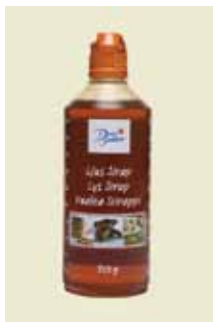
Ljus Sirap, 750 g Art nr: 46443

Sirap tillverkas av råsocker från sockerbetor och sockerrör. I sirap ingår varierande halter av färgämnen och aromer från rörssocker som bestämmer färg och smak. Sirap innehåller också olika sockerarter; vanligt socker, druvsocker och fruktsocker.