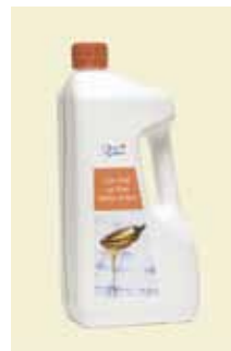
Ljus Sirap, 2,8 kg Art nr: 46430

Antal/bricka: 14 × 750 g Ljus Sirap är den klassiska bassirapen till godis, småkakor, efterrätter, såser, köträtter mm.