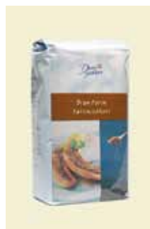
Farinsocker, 2 kg Art nr: 45205 Antal/bricka: 4 x 2 kg Foodservice förpackning