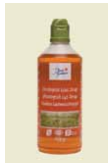
Ljus Sirap, Ekologisk, 750 g Art nr: 46439

Antal/bricka: 8 × 750 g Mörk Sirap har lite mera karaktär med fylligare karamellsmak och en tydlig aromatisk smak. Passar till såväl pepparkakor och chokladkola som bruna bönor, kåldolmar och andra maträtter.