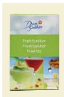
Fruktsocker, 500 g Art nr: 47403

Frukttårta med gelé, mousse, pannacotta och pudding – nu kan du snabbt och lätt göra det hela själv. Gelésocker Multi innehåller vegetabiliskt geleringsmedel och kan användas till en lång rad gelade desserter i stället för gelantin. Gelésockret ger en bra konsistens ihop med både vatten, fruktjuicer och mjölkprodukter – enkel och bekväm att använda!