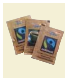
Rörsocker Strö Fairtrade Påse, 6 g, 5 kg, Wellåda Art nr: 41627 Antal/låda: 845 st