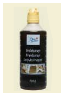
Brödsirap, 750 g Art nr: 46444

Antal/bricka: 8 × 750 g Vit Baksirap är utmärkt att använda när du bakar vetebroöd och bullar. Vetebroden och bullarna håller sig mjuka och färska längre och blir dessutom lite godare. Den Vita Baksirapen går också utmärkt att använda i godis, glass och andra desserter, matlagning och till pizza för att få en mjuk och luftig botten.