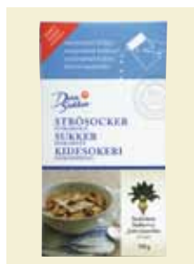
Strösocker, 750 g Art nr: 41221 Antal/bricka: 12 x 750 g Strösocker med mindre kristaller än vanligt Strösocker. Används i samma applikationer som vanligt Strösocker. Dessutom speciellt lämpligt till bakverk av olika slag som t ex rulltårta, småkakor och sockerkakor.