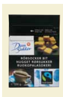
Rörsocker Bit Fairtrade, 500 g Art nr: 42512

Antal/bricka: 2 x 7 x 500 g Rörsocker Strö är ett guldgult socker med gyllene kristaller och aromatisk söt smak av karamell. Rörsocker används till drycker, exotiska rätter och garnering av kakor och desserter.