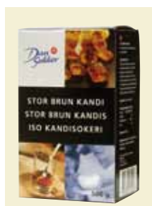
Stor Brun Kandi, 500 g Art nr: 47205

Antal/bricka: 10 × 500 g Råsocker Bit är ett guldgult socker med aromatisk söt smak, krispig och med stora kristaller.