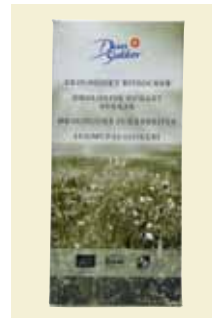
Bitsocker Ekologiskt, 1 kg Art nr: 42213 Antal/bricka: 9 × 330 g