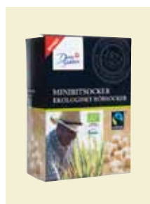
Minibitsocker Ekologiskt Rörsocker Fairtrade, 500 g Art nr: 42514

Antal/bricka: 12 × 500 g Stor Brun Kandi är extra stora sockerkristaller som tillverkas genom mycket långsam kristallisation. Den bruna färgen och aromen är resultatet av att sockret vid värmebehandling bildat välsmakande karamell-ämnen utan några extra tillsatser. Stor Brun Kandi är en utmärkt smaksättare i varma drycker.