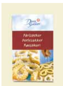
Pärlsocker, 500 g Art nr: 44201