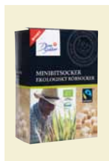
Minibitsocker Ekologiskt Rörsocker Fairtrade, 500 g Art nr: 42514

Antal/bricka: 10 x 500 g Rörsocker Bit är av högsta kvalitet, ett guldgult socker med aromatisk söt smak, krispigt och med stora kristaller. Dessutom ser det vackert ut i sockerskålen.