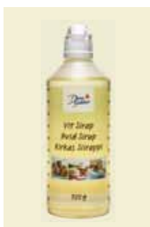
Vit Baksirap, 750 g Art nr: 46440

Antal/bricka: 8 × 750 g Vit Baksirap är utmärkt att använda när du bakar vetebroöd och bullar. Vetebroden och bullarna håller sig mjuka och färska längre och blir dessutom lite godare. Den Vita Baksirapen går också utmärkt att använda i godis, glass och andra desserter, matlagning och till pizza för att få en mjuk och luftig botten.