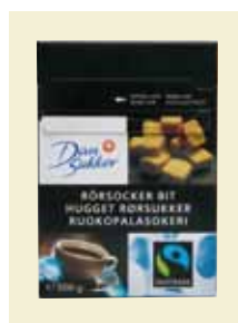
Rörsocker Bit Fairtrade, 500 g Art nr: 42512

Antal/bricka: 10 × 1 kg Hårda sockerbitar med lång smälttid.