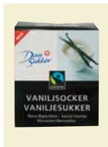
Vaniljsocker Fairtrade, 170 g Art nr: 47007

Antal/bricka: 16 × 170 g Vaniljsocker är utmärkt smaksättare i kakor och desserter och har en framträdande, god smak av vanilj. Vaniljaromen i Vaniljsocker är en blandning av naturidentisk vaniljarom som utvinns ur granved (lignin) och vanilj som utvinns ur vaniljstänger från vaniljorkidén. Vårt Vaniljsocker innehåller inte ethylvanillin, som är en helt syntetiskt framställd vaniljarom.