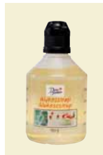
Glykossirap, 400 g Artnr. 46452

Antal/bricka: 8 × 400 g Cane Syrup har en rundare och fylligare smak och passar perfekt till all typ av bakning, i grytor, sallader, marinader – eller varför inte som topping? Sirapen är gjord på rörsocker och är dessutom rättvisemärkt.