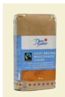
Ljust Muscovado-råsocker, 500 g Art nr: 41643

Antal/bunt: 10 x 1 kg Ekologiskt Rörsocker Fairtrade från Paraguay används som vanligt vitt strösocker och passar i många olika sammanhang.