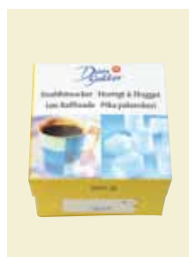
Snabbitsocker Bordsförpackning, 500 g Art nr: 42022

Antal/bricka: 12 × 1 kg Snabbitsocker innehåller sockerbitar med kort smälttid.