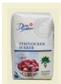
Strösocker, 1 kg Art nr: 41202 Antal/bunt: 10 x 1 kg