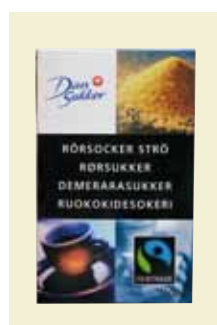
Rörsocker Strö, Fairtrade, 500 g Art nr: 41655

Namnet "Råsocker" på våra förpackningar ändras löpande till "Rörsocker". Produkten är densamma.