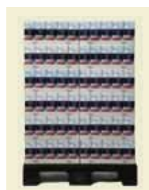
Florsocker 500 g ½-pall Artnr: 43721