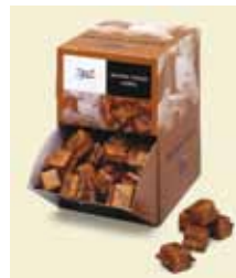
Rörsocker Bit Fairtrade, 2 stk, 1,05 kg, Display Art nr: 42229 Antal/låda: 160 st