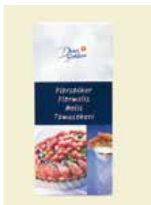
Florsocker, 500 g Art nr: 43200

Florsocker dekorerar och sötar desserter och bakverk. Det används till kakor, desserter, glasyr och kristyr, eller som dekoration pudrat över kakan, desserten mm. Det finns även som ett ekologiskt alternativ.