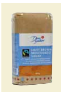
Ljust Muscovado- råsocker, 500 g Art nr: 41643 Antal/bricka: 6 x 500 g Ljust Muscovadoråsocker användes med fördel som krydda i matlagning. Passar mycket bra till fisk och rotfrukter. Förhöjer smaken på bröd, mjuka kakor, småkakor, desserter, marinader, såser och inläggningar.

Muscovadoråsocker är ett fuktigt och finkornigt rörsocker som har sitt ursprung på Mauritius. Muscovadosockret utvinns ur sockerrör. Sockret har behandlats så lite som möjligt för att aromen och färgen ska bevaras. Det ljusa sockret påminner lite om smörkola och det mörka har ett drag av lakrits. Muscovadoråsockret är dessutom Fairtrade märkt.