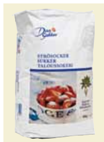
Strösocker, 10 kg Art nr: 41250 Socker i hanteringsvänlig Foodservice förpackning