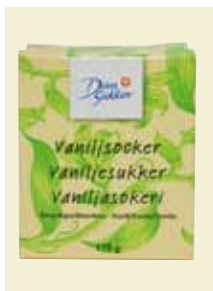
Vaniljsocker, 170 g Art nr: 47006

Antal/bricka: 16 × 170 g Vaniljsocker är utmärkt smaksättare i kakor och desserter och har en framträdande, god smak av vanilj. Vaniljaromen i Vaniljsocker är en blandning av naturidentisk vaniljarom som utvinns ur granved (lignin) och vanilj som utvinns ur vaniljstänger från vaniljorkidén. Vårt Vaniljsocker innehåller inte ethylvanillin, som är en helt syntetiskt framställd vaniljarom.