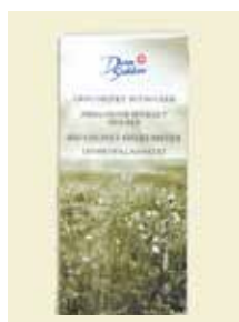
Bitsocker Ekologiskt, 1 kg Art nr: 42213

Antal/bricka: 10 × 750 g På Bit är extra hårda sockerbitar med lång smälttid att dricka på bit.