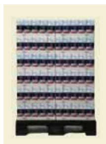
Florsocker 500 g 1/2-pall Artnr: 43721

Flor med chokoladsmaak är en smaksatt produkt för användning till glasyr och som smaksättning av bakverk och liknande.