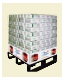
Syltsocker 1 kg ½-pall Artnr. 47117