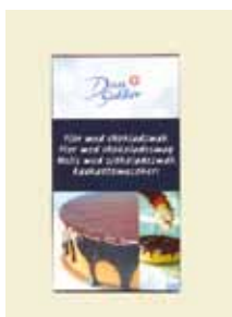
Flor med chokladsmak, 300 g Art nr: 43718