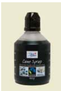
Cane Syrup Fairtrade, 400 g Art nr: 46438

Antal/bricka: 8 × 750 g Brödsirapen innehåller malt som gör matbröden mustigare och saftigare. Malten hjälper nämligen till att förstärka sirapens goda bakegenskaper. Brödsirap kan även användas till ljusa och mörka matbröd.