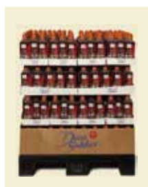
Ljus Sirap 750g ½-pall Artnr. 46441