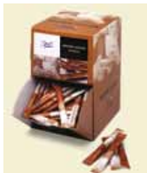
Rörsocker Strö Fairtrade, Sticks, 5 g, 1,0 kg, Display Art nr: 41608 Antal/låda: 200 st