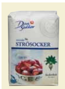
Strösocker, 2 kg Art nr: 41101 Antal/bunt: 6 x 2 kg. Producerat i Sverige

Rörsocker används till drycker, exotiska rätter och garnering av kakor och desserter. Det är ett guldgult socker med gyllene kristaller och aromatisk söt smak av karamell. Kan också användas till garnering av kakor och desserter och ser vackert ut i sockerskålen. Vårt rörsocker är av högsta kvalitet.