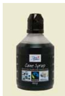
Cane Syrup Fairtrade, 400 g Art nr: 46438

Antal/bricka: 8 x 170 g Vaniljsocker Fairtrade tillverkas av fairtrade märkt finmalt rörsocker och fairtrade märkt vanilj som utvinns ur vaniljstänger från vaniljorkidén. Vaniljsockret har en mild, fin smak av vanilj och är en utmärkt smaksättare i kakor och desserter.