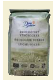
Strösocker Ekologiskt, 1 kg Art nr: 41210 Antal/bunt: 10 × 1 kg