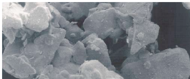
Ātri šķīstošā cukura daļiņa 600-kārtīgā palielinājumā. Attēlā var redzēt daļiņas poraino virsmu.