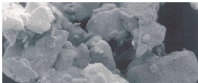
Kiirlahustuva suhkru 600-kordne suurendus. Pildil on näha osakeste poorsus.